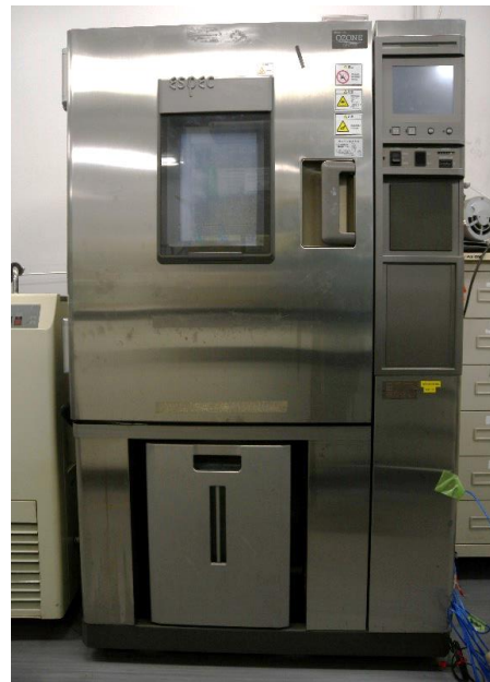
恒温恒湿器の外観