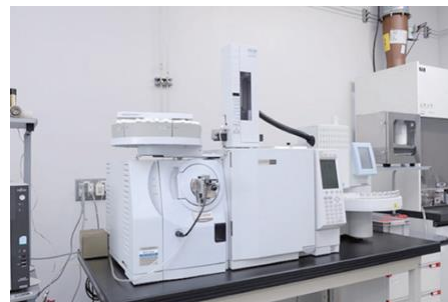
ガスクロマトグラフ質量分析計 (GC/MS)

地球温暖化対策の推進に関する法律により特定排出者は自らの温室効果ガスの排出量を報告することになっています。弊社ではGC/MS法やGC法、IC法により対象成分の分析を行っております。