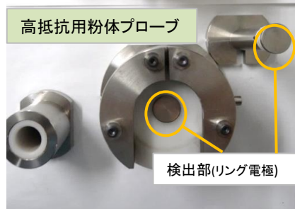
検出部(リング電極)