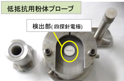
検出部(四探針電極)