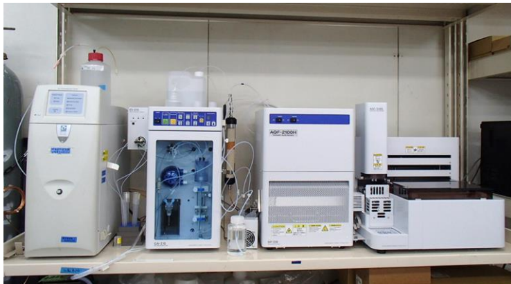
イオンクロマトグラフ 吸収ユニット 電気炉 サンプルフィーダー