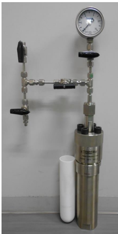
0.2L 小型圧力容器の外観

当社では小型圧力容器を用いて、各種冷媒、冷凍機油中での樹脂の浸漬試験を実施することが可能です。